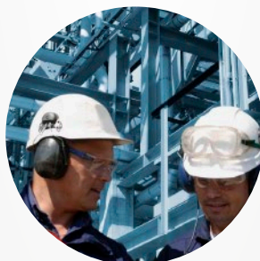
INSTALACIONES Y MONTAJES INDUSTRIALES